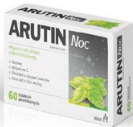
Дозировка: 505 мг x 60 таблеток