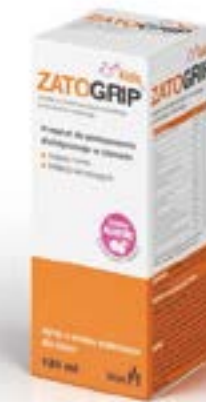
Дозировка: Сироп 120 мл

**%RDA (рекомендованная суточная доза): 30% рекомендованной суточной нормы цинка