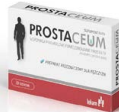
Дозировка: 894 мг × 30, 60 таблеток