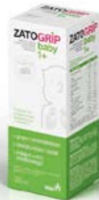
Дозировка и форма выпуска: сироп 120 мл

Состав, энергетическая и пищевая ценность