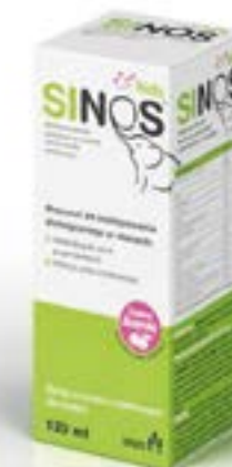
Дозировка: Сироп 120 мл

* RDA (рекомендованный полноценный рацион питания): 40% рекомендованной суточной нормы витамина С