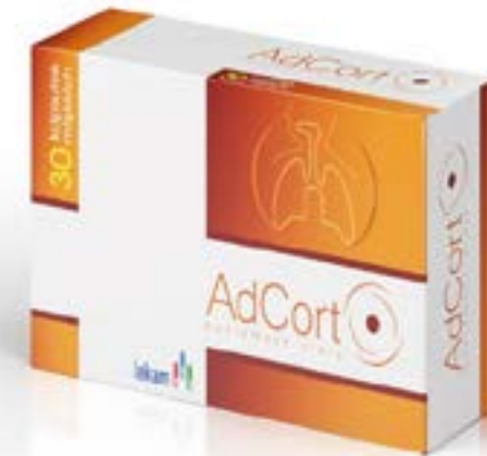
Дозировка: 1700 мг x 30 капсул