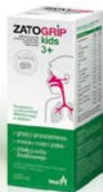
Дозировка и форма выпуска: сироп 120 мл

Ингредиенты сиропа содействуют правильному функционированию иммунной системы Вашего тела.