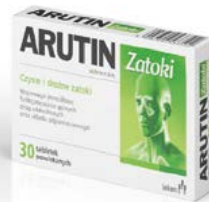
Дозировка: 210 мг x 30 таблеток