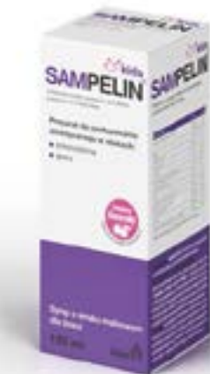
Дозировка: Сироп 120 мл

Натуральные экстракты, содержащиеся в сиропе SAMPELIN®, поддерживают дыхательную систему, уменьшая приступы кашля и боль в горле, снимают раздражение в ротовой полости и гортани, и, кроме того, поддерживают нормальное функционирование иммунной системы организма. Помимо этого, благодаря ксилиту препарат заботится о зубах детей, поддерживая их минерализацию.